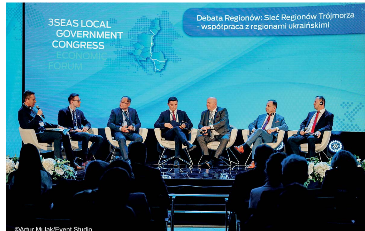
Łącznie Deklarację podpisało piętnaście regionów z pięciu państw należących do Inicjatywy Trójmorza

państw wchodzących w skład Inicjatywy Trójmorza, która powstała z myślą o lepszym wzajemnym poznaniu specyfiki i posiadanych potencjałów.