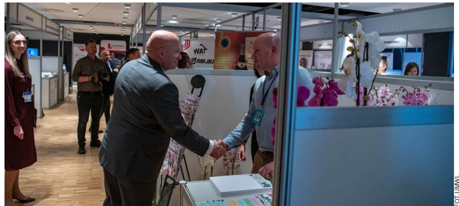
Wizyta w strefie wystawienniczej, czerwiec 2022

Forum Gospodarcze stanowi przestrzeń do promocji oferty MŚP z województwa lubelskiego, tworzenia warunków dla rozwoju przedsiębiorczości oraz obsługi inwestora, a także rozwijania zaawansowanych form współpracy międzynarodowej.