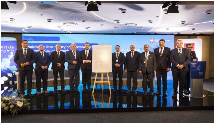
Ogłoszenie nowych gospodarczych inicjatyw WL, czerwiec 2022

Forum Gospodarcze będzie strefą wymiany doświadczeń biznesowych oraz okazją do prezentacji przedsiębiorstw i regionów z krajów Trójmorza