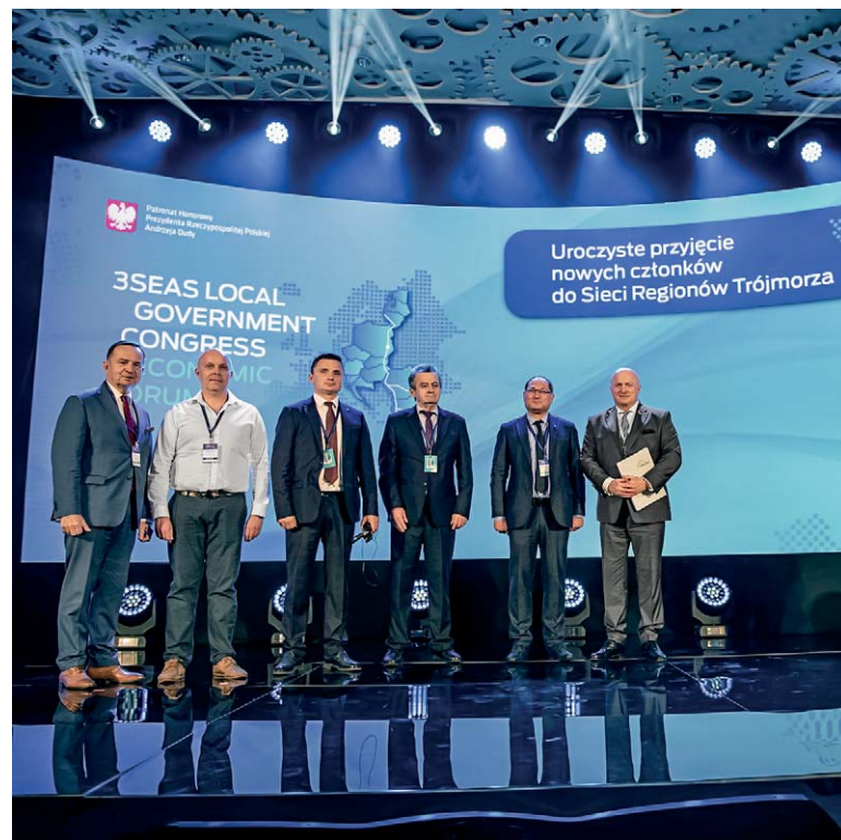
W 2022 roku deklarację przystąpienia do Sieci złożyło kolejnych 5 regionów