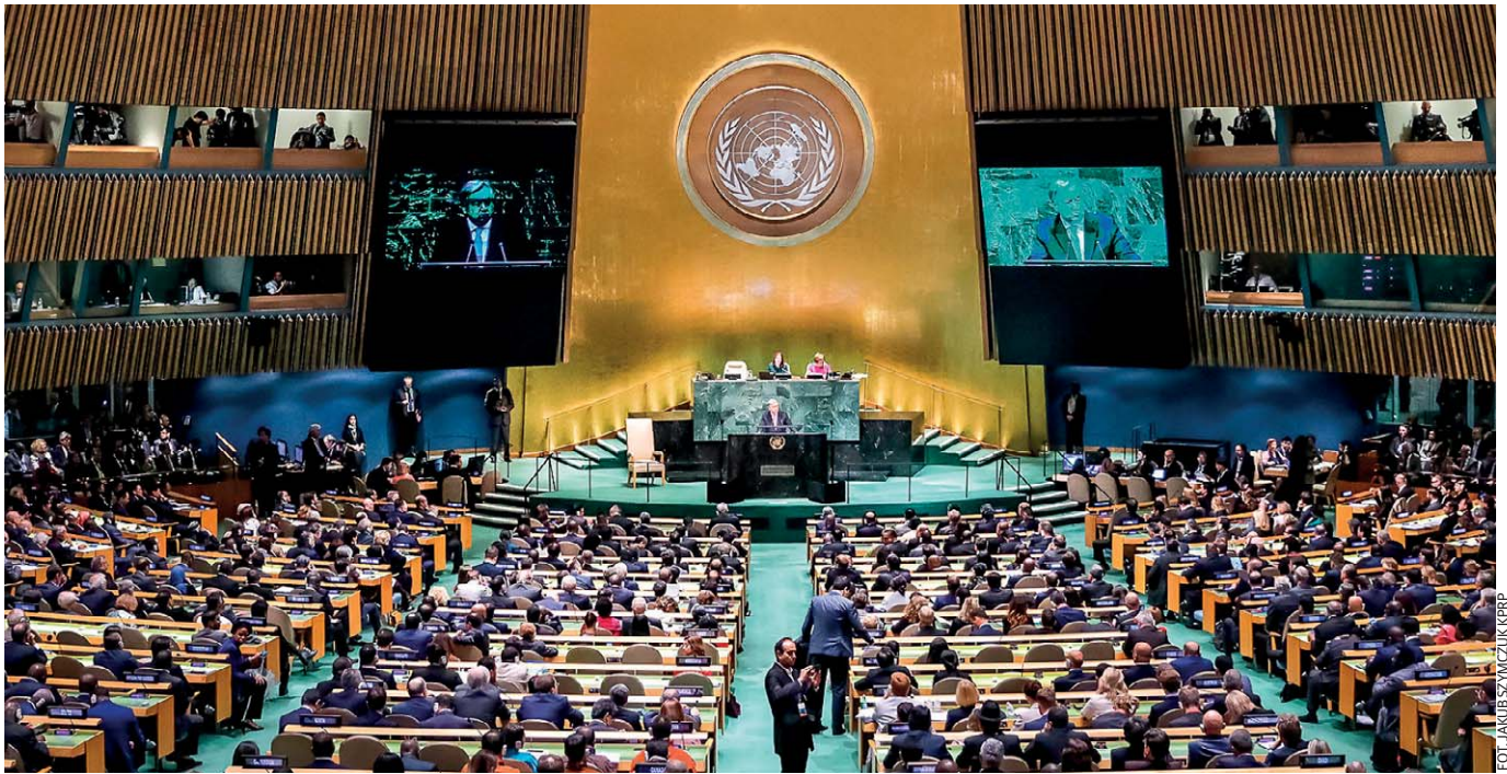
Za przyjętą rezolucją Zgromadzenia Ogólnego ONZ kryły się wielomiesięczne negocjacje

Myślenie, które zaczęliśmy w ramach Inicjatywy Trójmorza, stało się uniwersalnym modelem dla świata - powiedział stały przedstawiciel RP przy ONZ Krzysztof Szczerski, komentując przyjętą w Zgromadzeniu Ogólnym, zainicjowaną przez Polskę, rezolucję na temat połączeń infrastrukturalnych