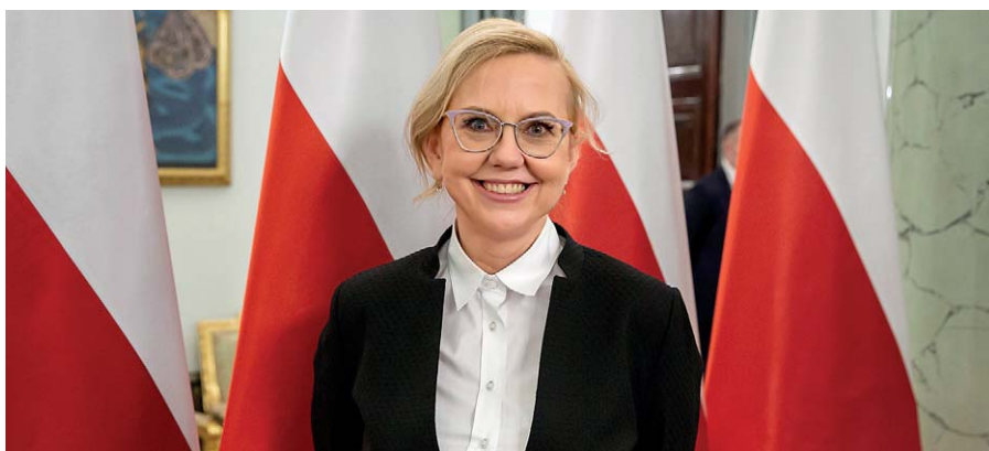
Anna Moskwa od 2021 r. jest ministrem klimatu i środowiska

Anna Moskwa: Niezależność energetyczna kraju jest kluczowym filarem jego bezpieczeństwa, dlatego Polska nie może sobie pozwolić na zbyt pospieszną dekarbonizację, póki nie zostanie zbudowany nowy, stabilny system energetyczny, oparty na miksie różnych źródeł energii, w tym tych niezależnych od pogody - elektrowniach szczytowo-pompowych, biogazowniach, geotermii oraz energetyce jądrowej.