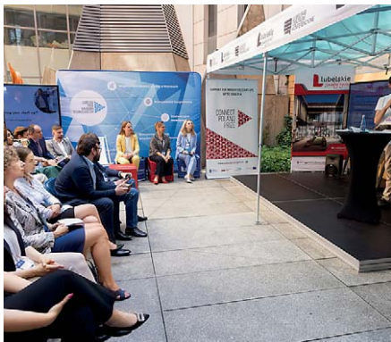
Wydarzenie dla start-upów, czerwiec 2022