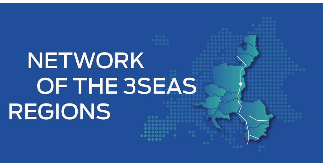
W Kongresie Trójmorza weźmie udział ponad tysiąc osób, które reprezentują 244 regiony z 12 krajów

Do udziału w Sieci zaproszone są wszystkie regiony z Inicjatywy Trójmorza na różnych szczeblach (NUTS2 i NUTS3), jest ich ponad 240. Powołane w strukturze Kancelarii Marszałka Województwa Lubelskiego, Biuro Sieci Regionów jest gotowe do współpracy z kolejnymi partnerami.