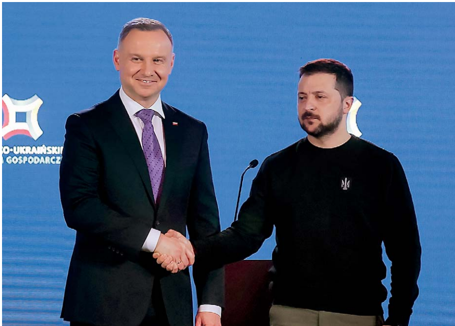
Prezydenci Andrzej Duda i Wołodymyr Zełenski podczas Polsko-Ukraińskiego Forum Gospodarczego

– Mimo wojny, obroty Polski z Ukrainą są rekordowe, jesteśmy największym partnerem handlowym Ukrainy i wierzę, że tak właśnie pozostanie