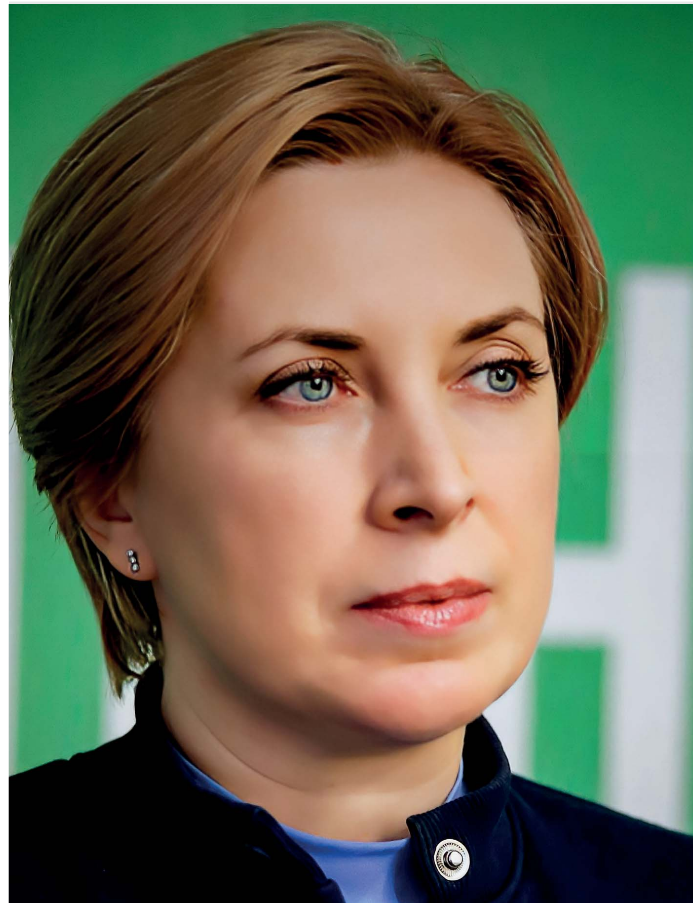
Od pierwszych dni pełnowymiarowej inwazji Polska otworzyła drzwi dla uciekających przed wojną Ukraińców - podkreśla wicepremier

Nasze kraje zmieniają układ sił w Europie. My, jako kraje graniczące z państwem terrorystycznym, staliśmy się tarczą dla całej Europy. Od stabilności naszych państw zależy bezpieczeństwo nie tylko na kontynencie europejskim, ale w całym cywilizowanym świecie. Społeczność globalna musi to zrozumieć i uznać.