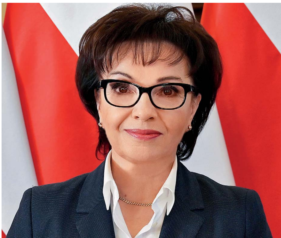
Elżbieta Witek zasiada w Sejmie od 2015 r.

Elżbieta Witek, Marszałek Sejmu: Zerwanie tradycyjnych szlaków transportowych ze wschodu, poszukiwanie alternatywnych dostawców surowców energetycznych czy wojna informacyjna i cyberbezpieczeństwo to wyzwania, z którymi aktualnie mierzą się przywódcy polityczni.